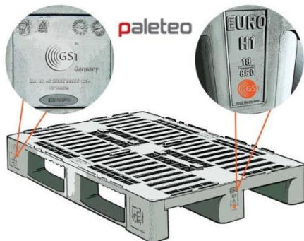
Grafika: H1 Znakowanie palet Higienicznych zgodnie z wymaganiami GS1